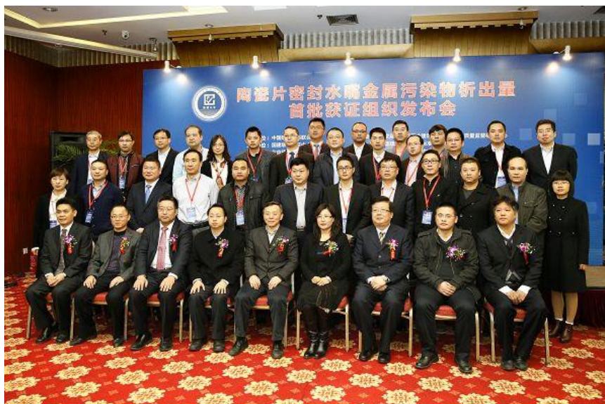
与会领导和获证组织代表合影

密封水嘴金属污染物析出量首批获证组织发布会。该项工作是加强建材行业标准化和质量管理工作的重要举措，不仅能够使水嘴金属污染物析出得到有效监控，更重要的是使生产企业进一步关注在生产工艺、关键原材料使用、金属污染物析出检测等过程建立质量保证体系，是规范企业生产行为自律的保证，也是向消费者提供公共信息的需要。该项工作也是为了推动 GB18145-2014《陶瓷片密封水嘴》标准的实施。