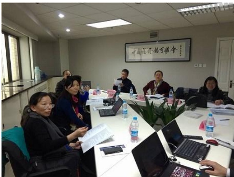
《能源管理体系 建材企业（不含水泥、玻璃、陶瓷企业）认证要求》标准审查会

2013-2014 年，我机构先后完成了国家认监委《能源管理体系 水泥企业认证要求》(RB/T 106-2013)、《能源管理体系 玻璃企业认证要求》(RB/T 111-2014) 和《能源管理体系 建筑卫生陶瓷企业认证要求》(RB/T 110-2014) 等标准的起草工作。2015 年，我机构承担了国家认监委《能源管理体系 建材企业（不含水泥、玻璃、陶瓷企业）认证要求》标准的起草工作，目前，该标准已通过标准审定委员会审查，正式报送国家认监委。上述四个标准同属能源管理体系认证系列标准，是 GB/T 23331-2012《能源管理体系 要求》在建材企业的具体要求。制定该标准的目的是为了规范建材企业能源管理过程，协助企业建立一套系统、科学且具有可操作性的能源管理体系，实施持续改进，实现能源目标，提高能源绩效，促进节能减排工作目标的实现。