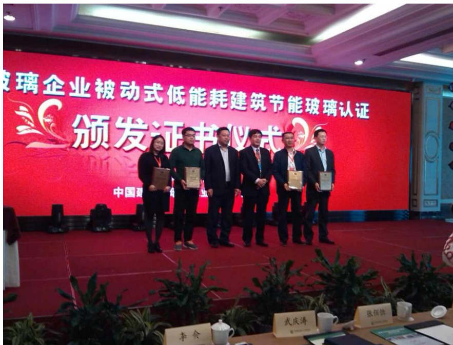
首批中空玻璃产品认证证书颁发仪式