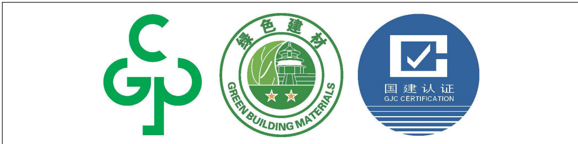
6) 三星级绿色建材产品认证标识