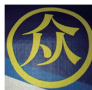
北京华阳众信建材有限公司